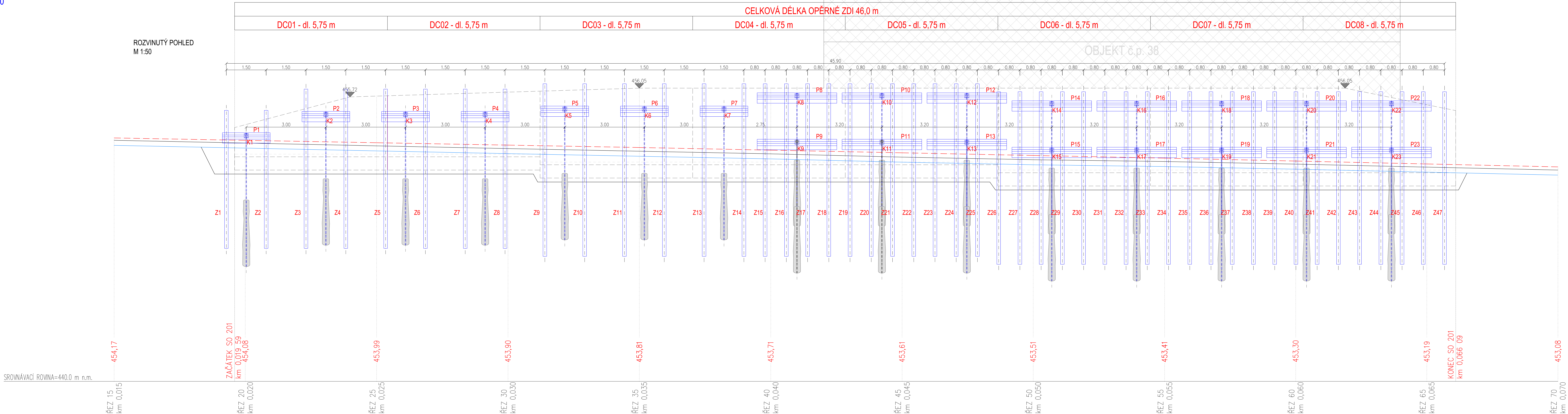
ROZVINUTÝ POHLED M 1:50